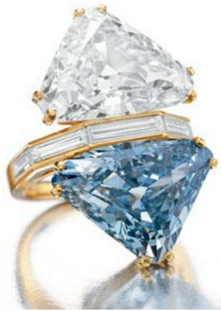
宝格丽蓝钻。一颗三角形切割的10.95克拉的鲜艳蓝色钻石。 1970年代售价为 100万美元 ，2010年的秋季拍卖会上卖价为 1570万美元 。

从历史上看，彩色钻石是在通货膨胀和货币贬值的时期中，表现最好的资产。20世纪70年代初开始有了正式的记录，我们便可看到，最高等级彩钻的价格，平均每年都会上涨10%-15%，颜色越稀有的和等级越高的彩钻，升值幅度也最大——即使在大萧条时期。