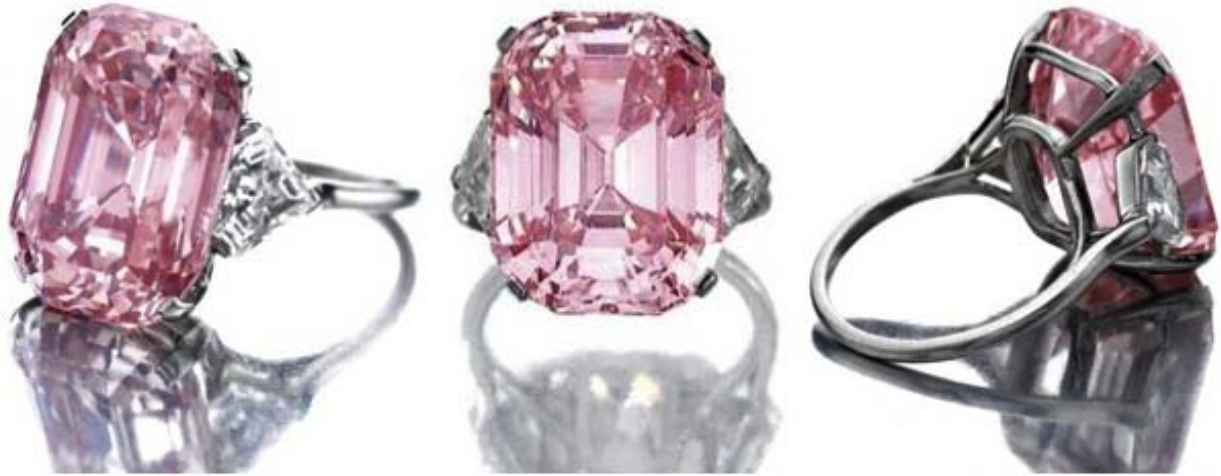
格拉夫粉钻。一颗罕见的24.78克拉的祖母绿切割浓彩粉色钻石。20世纪60年代纽约珠宝商哈里温斯顿以 6万美元 的价格买入，在2010年11月的拍卖会上拍出 4575万美元 高价。

正如上面提到的，彩钻的价格仍在不断上涨。“天然彩钻市场目前势头强劲，去年一年中价格上升了25%”，戴比尔斯伦敦公司的副总裁安德鲁考克森表示。